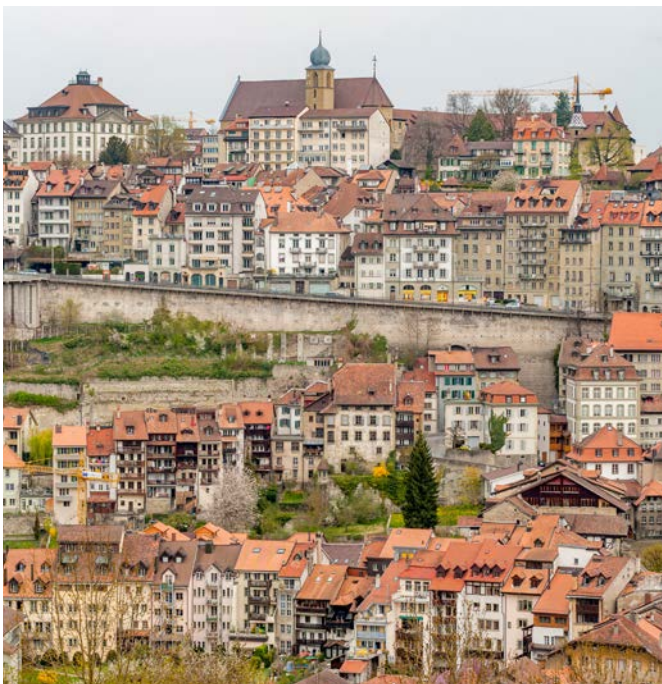
Abbildung 1 Einfache Anpassungen in Art. 262 OR zur Untermiete.