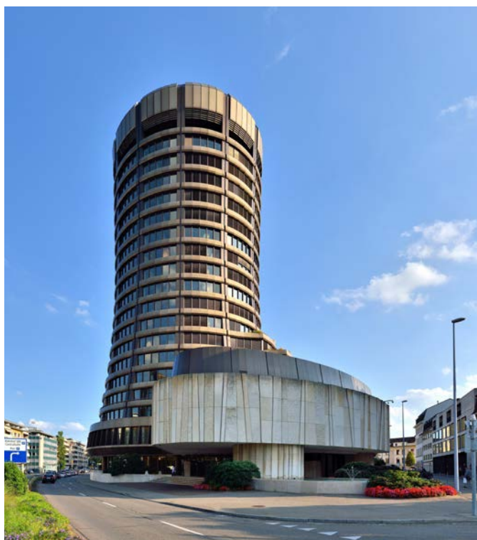
Bildlegende: Das «Allerheiligste» der weltweiten Finanzwelt in Basel: Die Bank für Internationalen Zahlungsausgleich BIZ.

Es bleibt die eine Frage: Wer treibt eigentlich diese weltweit koordinierte, endzeitliche, diktatorische Kontrolle über jedes einzelne Individuum dieses Planeten an? Wer, ausser den Globalisten? (Mehr zum Thema «Globalisten» unter www.gebet-globalisten.ch ) ●