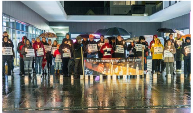
Mahnwache in Buchs SG

Bildlegende: An den CSI-Mahnwachen stehen Freiwillige für Menschen ein, die besonders um die Weihnachtszeit wegen ihres Glaubens bedroht werden.