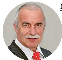
Markus Wäfler, alt Nationalrat EDU ZH

Die europäischen Staaten, inkl. die Schweiz, sind mit dem Massen-Asylmissbrauch mit Asylverfahren, Unterbringung und Versorgung von Asylanten seit langem völlig überfordert. Das Verhalten von einzelnen Asylantengruppen verursacht in der Bevölkerung zusätzlich Unzufriedenheit.