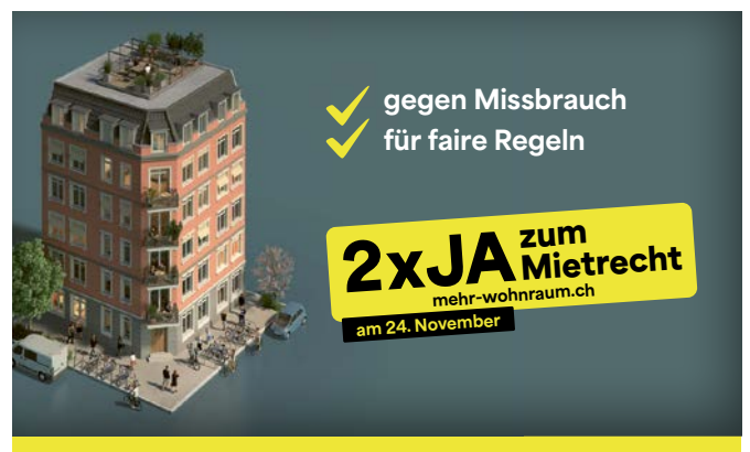
Abbildung 2 Änderung von drei Artikeln im Obligationenrecht (OR) zur Kündigung wegen Eigenbedarf.